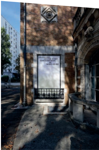
La Galerie, Centre d'art contemporain de Noisy-le-Sec

is goedkoop, er is veel ruimte en de rijke clientèle kan hun privévliegtuig parkeren op het nabijgelegen vliegveld Le Bourget. Gelukkig mogen ook gewone stervelingen genieten van de uitzonderlijke exposities die deze galeries organiseren en waarvoor kosten noch moeite gespaard worden. Nadat deze twee giganten de sprong gewaagd hadden, lag de weg open voor