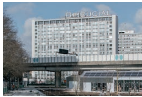
Poush Manifesto, foto's Philippe Billard