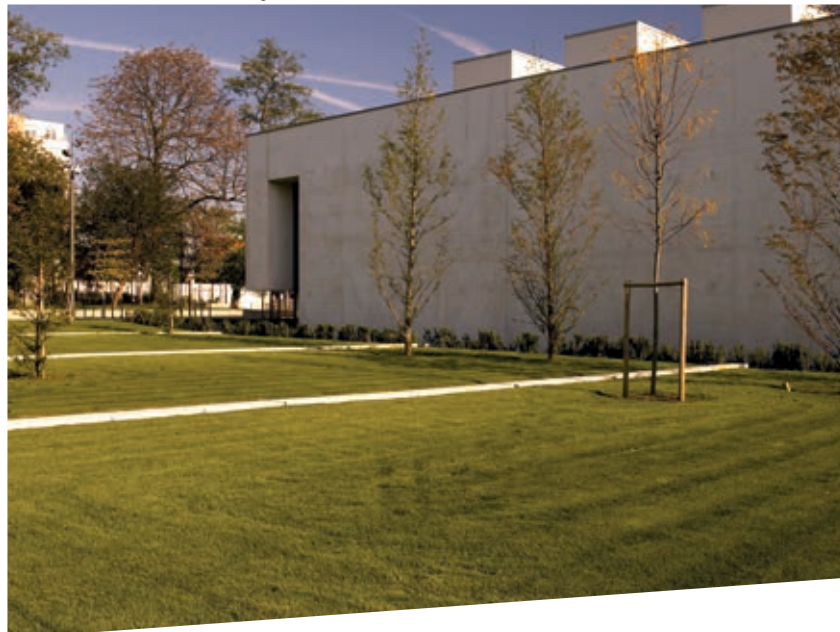
MAC VAL, foto Marc Damage