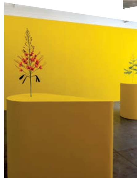
Kapwani Kiwanga, The Marias , 2020, tentoonstelling bij le Crédac, courtesy de kunstenaar en galerie Poggi, foto Marc Damage