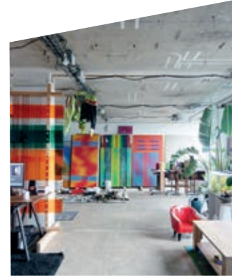
Atelier van Nano Ville bij Poush