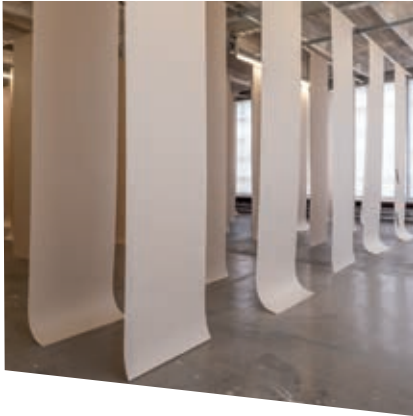
Kapwani Kiwanga, Matières premières , 2020, tentoonstelling bij le Crédac

Daar waar in Parijs l'art pour l'art de maat slaat, doet engagement dat in de voorsteden. Een museum als het MAC VAL zoekt in de programmering aansluiting met de maatschappij door relevante onderwerpen te belichten. Tevens werkt het, net als La Galerie, samen met kunstenaars die net als de lokale bewoners een migratieachtergrond of dubbele nationaliteit hebben. Het lokale publiek maakt meestal de hoofdmoot uit. Het sensibiliseren van bezoekers voor beeldende kunst is essentieel en daar worden allerlei innovatieve benaderingen voor ontwikkeld. Vergeet niet dat in sommige