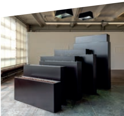
Kapwani Kiwanga, Oryza , 2021, tentoonstelling bij le Crédac