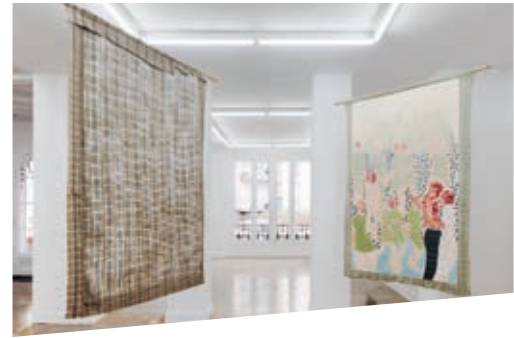
Zaaloverzichten van de tentoonstelling À corps défendant met werk van Karim Kal en Nengi Omuku, bij La Galerie, Centre d'art contemporain de Noisy-le-Sec, 2021