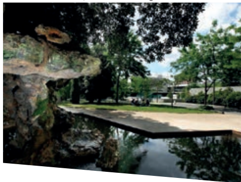
Tuin MAC VAL, foto Marc Damage