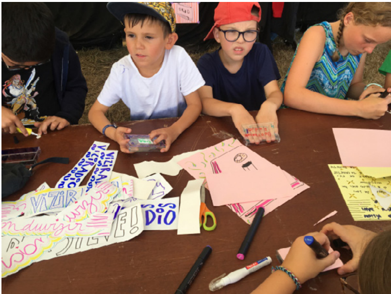
Vision Festival, Août 2019

Ce travail de transmission est pour Viziradio un axe politiquement fort. Prendre le temps d'écouter.