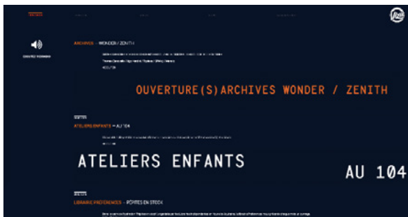
Site internet viziradio page live/news

Vizir crée pour chacun d'eux un espace propre sur sa plateforme. Chaque correspondant a sa vignette et sa page sur Viziradio.com